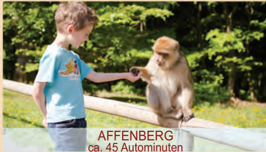
AFFENBERG ca. 45 Autominuten