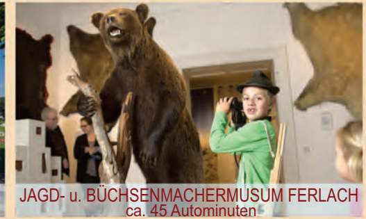
JAGD- u. BÜCHSENMACHERMUSUM FERLACH ca. 45 Autominuten