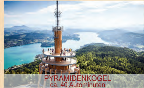
PYRAMIDENKOGEL ca. 40 Autominuten