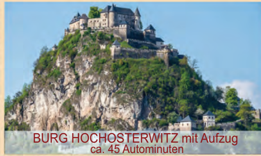
BURG HOCHOSTERWITZ mit Aufzug ca. 45 Autominuten