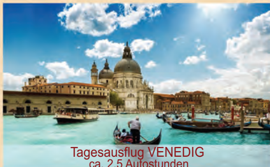
Tagesausflug VENEDIG ca. 2,5 Autostunden