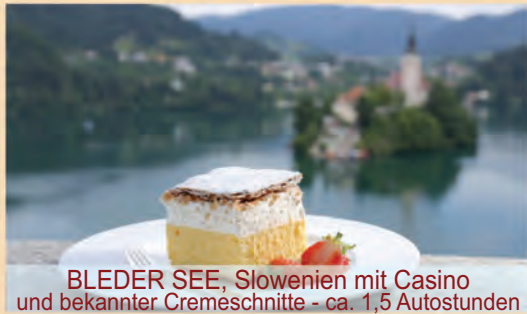
BLEDER SEE, Slowenien mit Casino und bekannter Cremeschnitte - ca. 1,5 Autostunden