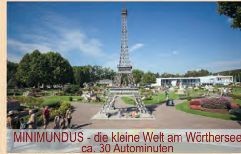
MINIMUNDUS - die kleine Welt am Wörthersee ca. 30 Autominuten