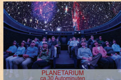
PLANETARIUM ca. 30 Autominuten