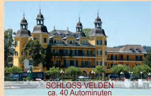
SCHLOSS VELDEN ca. 40 Autominuten