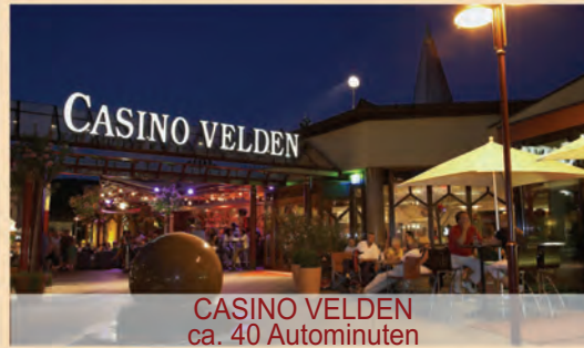
CASINO VELDEN ca. 40 Autominuten