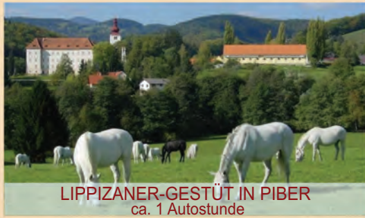
LIPPIZANER-GESTÜT IN PIBER ca. 1 Autostunde