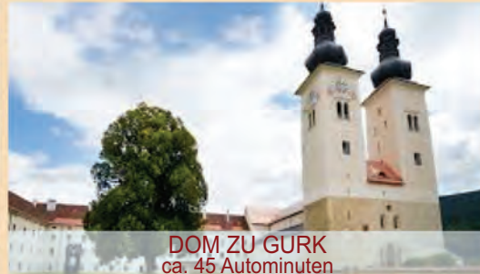
DOM ZU GURK ca. 45 Autominuten