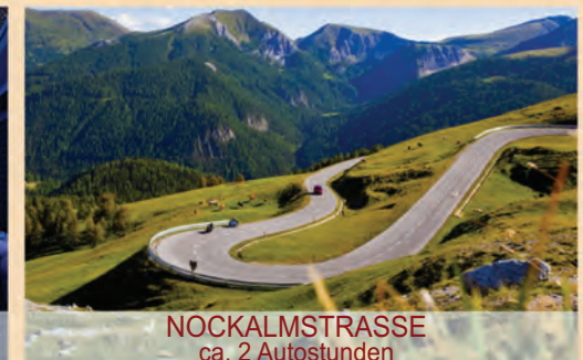
NOCKALMSTRASSE ca. 2 Autostunden