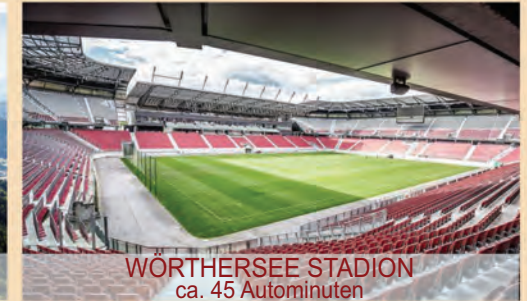
WÖRTHERSEE STADION ca. 45 Autominuten