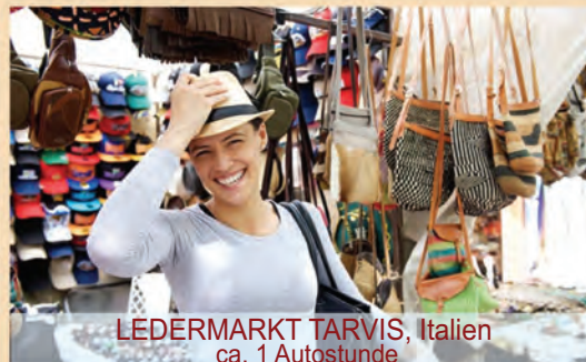
LEDERMARKT TARVIS, Italien ca. 1 Autostunde