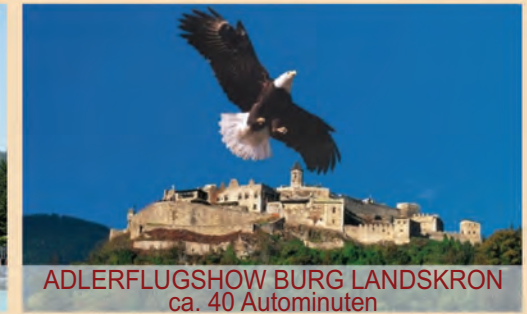
ADLERFLUGSHOW BURG LANDSKRON ca. 40 Autominuten